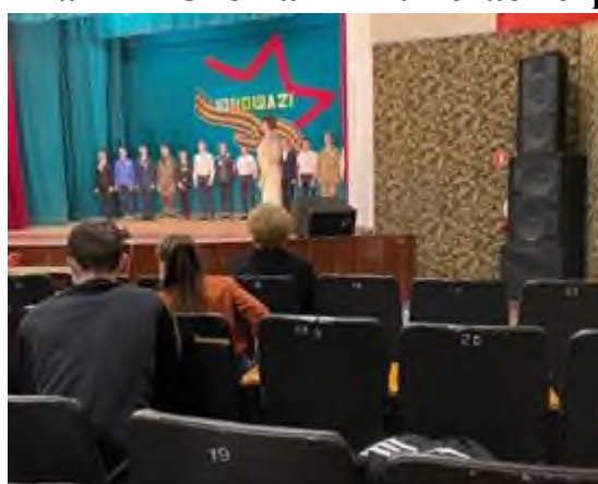
Городской конкурс «Виват, Россия!»-3 место