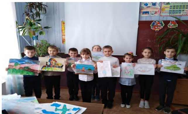
Участие в городском конкурсе рисунков в ходе месячника героико-патриотического воспитания «Это память листает страницы»