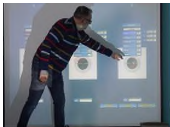
Соревнования по военно-прикладным видам спорта -1 место