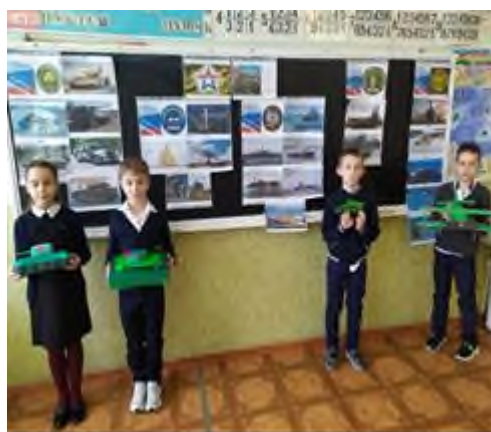
Турнир по шашкам и шахматам-2 место Конкурс поделок военной техники (1-2 места )