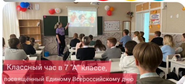
Классный час в 7 "А" классе, посвящённый Единому Всероссийскому дню